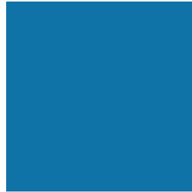
90 C 50 M 15 Y 0 K